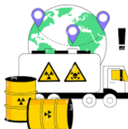
Transport de Marchandises Dangereuses