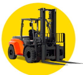
CACES et Autorisations de Conduite